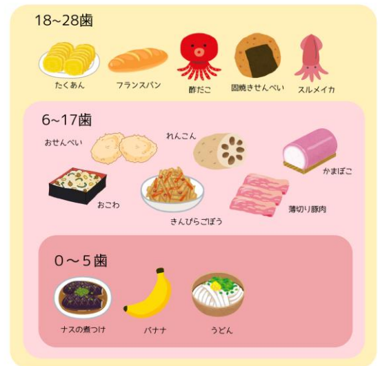
おいしく食べられる歯の本数